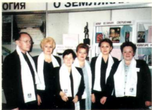
Дни Нижневартовского района в Ханты-Мансийске.