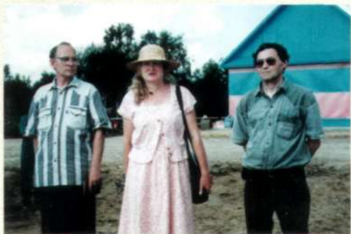
Встреча с жителями д. Пасол