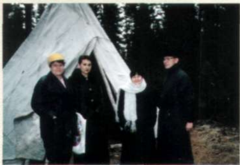
В Мегионском этнографическом музее.